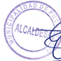
ELIANA OLMOS SOLÍS ALCALDESA