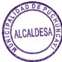
ELIANA OLMOS SOLÍS ALCALDESA